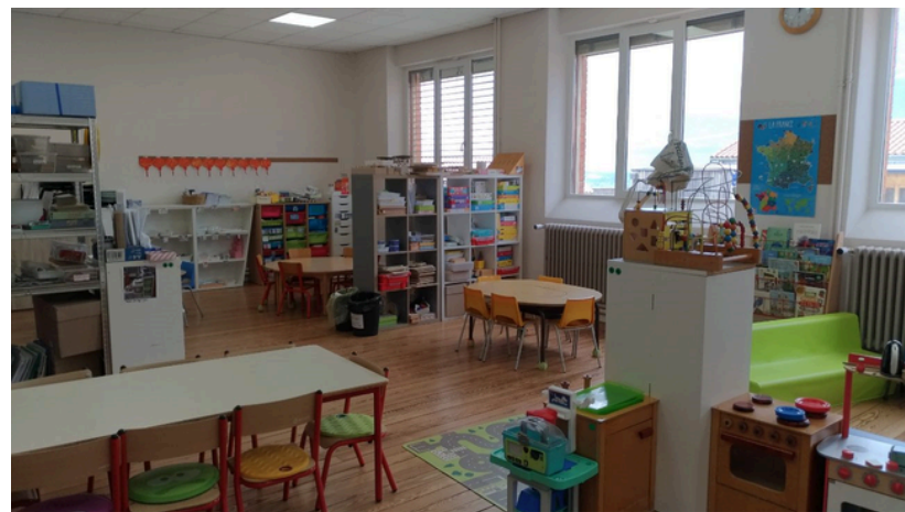
La classe de PS/MS installée salle Paul Claudel

La commune de Pomeys est heureuse de pouvoir compter sur cette structure de proximité qui participe pleinement à l'accueil des jeunes enfants et à l'attractivité de notre village.